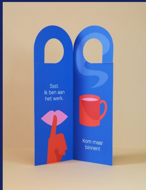
Deurhanger [rode zijde: triggerende boodschap | blauwe zijde: deurhanger voor eigen gebruik tijdens thuiswerkdag]