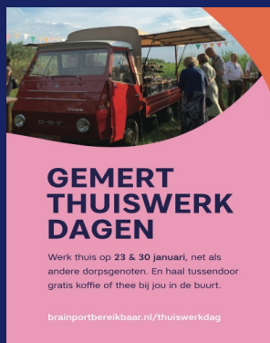
Uitnodiging A5 met koffie voucher [in brievenbus van iedere woning in de gemeente]