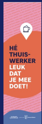
Vlag bij Barista