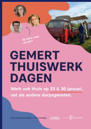
Driehoeksbord langs de weg